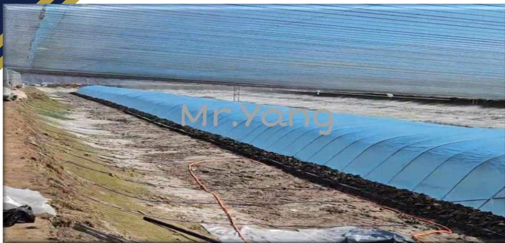
รูปจากเฟสบุ๊ก Yang Dongliang คุณรัฐพล นงศ์ชะเนา