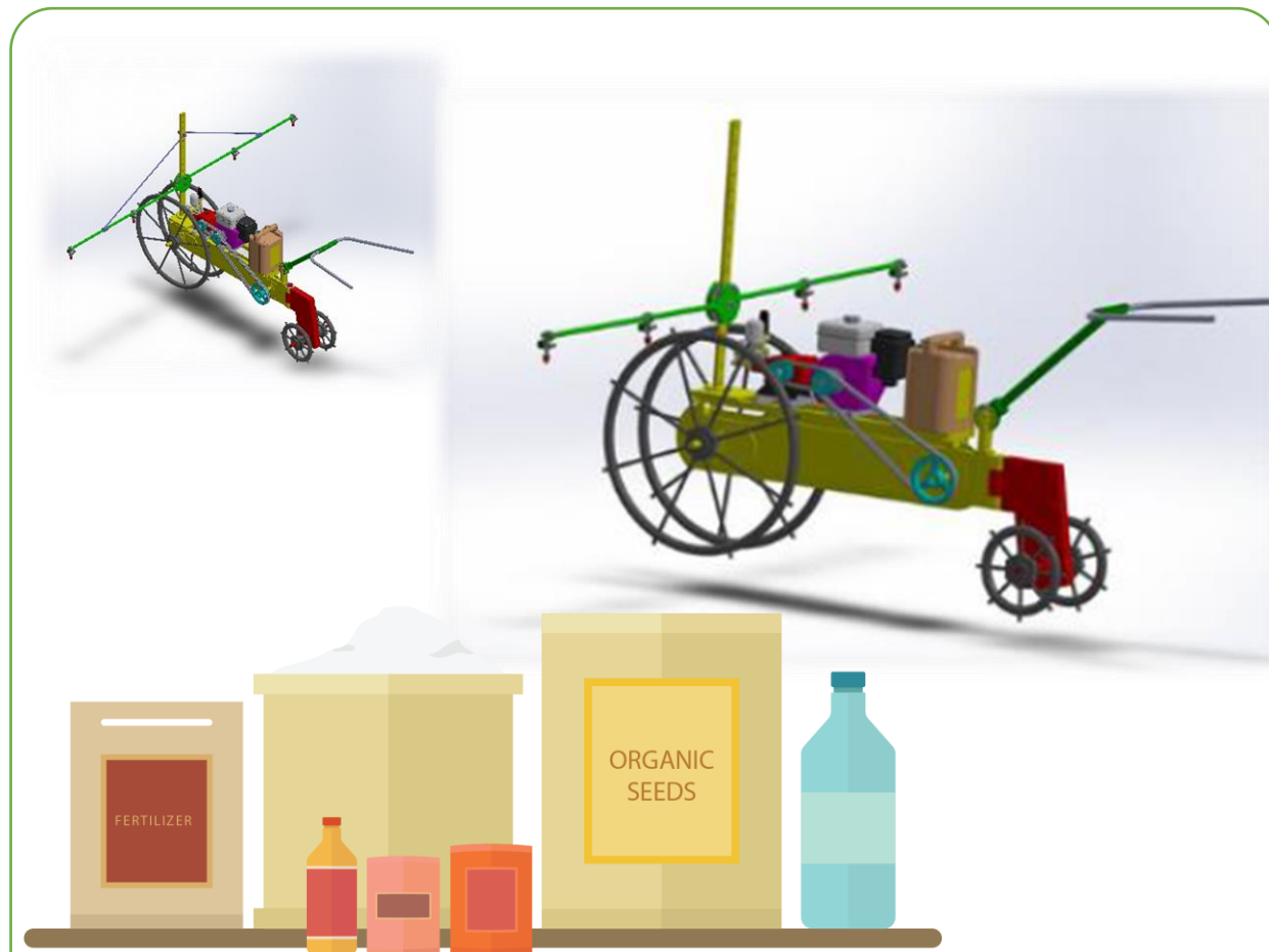
เครื่องฟ่นชีวภาพกำจัดศัตรูพืช 1.7 ลบ.