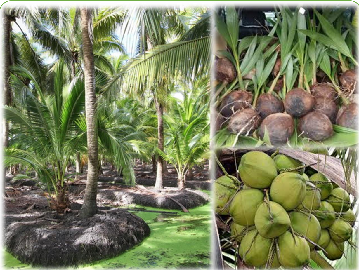
มะพร้าวน้ำหอม GI จังหวัดราชบุรี 4.7 ลบ.

สนับสนุนทุนวิจัยตามอัตลักษณ์ของท้องถิ่น 6.4 ลบ.