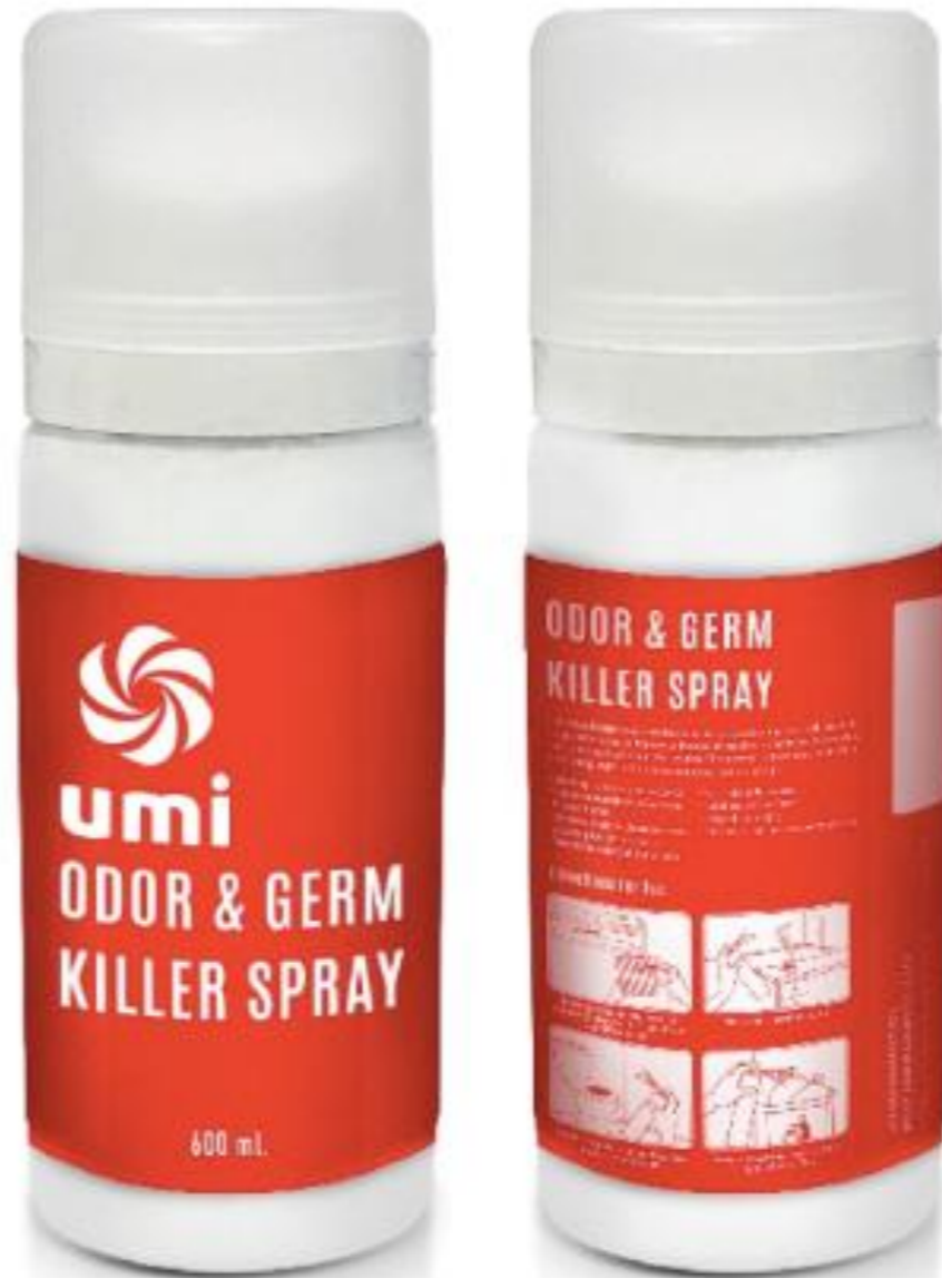
Label Odor&Germ Killer Spray (Small Size) (edit1)