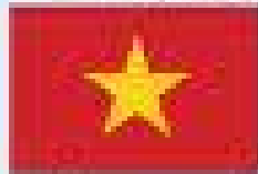
เวียดนาม Vietnam