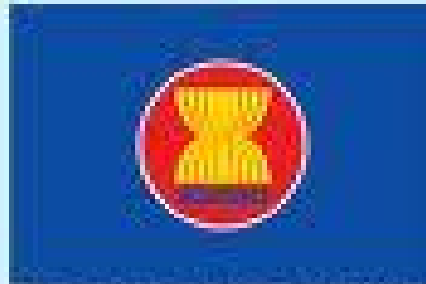
อาเซียน Association of Southeast Asian Nations

สมาคมประชาชาติแห่งเอเชียตะวันออกเฉียงใต้