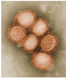
ไวรัส Swine influenza

เชื้อดั้งเดิม Swine influenza เป็นโรคติดเชื้อระบบทางเดินหายใจที่พบในสุกร มีสาเหตุจากการติดเชื้อไวรัสไข้หวัดใหญ่ชนิดเอ ซึ่งมักจะเกิดการระบาดขึ้นเป็นปกติอยู่แล้ว และโดยปกติไวรัสดังกล่าวจะไม่สามารถติดเชื้อข้ามมาสู่มนุษย์ อย่างไรก็ตามหากมีการสัมผัสสุกรที่เป็นโรค จะทำให้มีติดเชื้อ และเกิดการแพร่เชื้อในมนุษย์ได้ ในกรณีที่มีการสัมผัสอย่างใกล้ชิด การติดต่อรวมถึงอาการของโรคมีลักษณะเหมือนกับการติดเชื้อไข้หวัดใหญ่ตามฤดูกาล (Seasonal influenza) ได้แก่ มีไข้ ไอ เจ็บคอ ปวดเมื่อยตามกล้ามเนื้อ ปวดศีรษะ อ่อนเพลีย และมีอาการหนาวสั่น บางรายอาจท้องเสีย และคลื่นไส้อาเจียน ทั้งนี้อาจมีอาการรุนแรง เช่น ปอดบวม ระบบทางเดินหายใจล้มเหลวจนเสียชีวิตในที่สุด